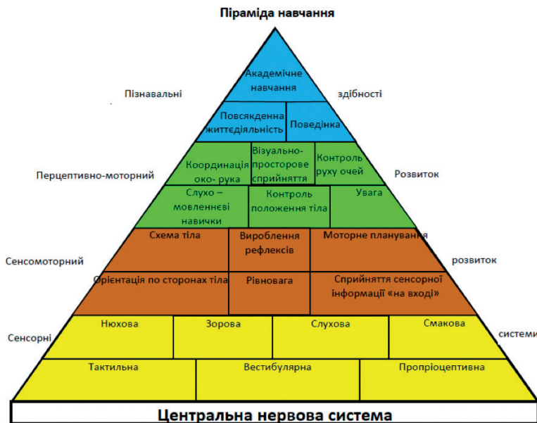
Мал. 1. Модифікована піраміда навчання

Сенсорна інтеграція— це структуризація відчуттів, які обробляються мозком з метою подальшого реагування на ці відчуття. У дітей, які мають сенсорні порушення розвитку, можлива дезінтеграція усіх сенсорних систем (зорова, слухова, тактильна, нюхова, пропріоцептивна, вестибулярна тощо). Дезінтеграція (порушення здатності нервової системи переробляти сигнали, які надсилає тіло в мозок) тої чи іншої сфери може мати форму як гіперчутливості (дитина підсилено сприймає ці відчуття і буде їх уникати, оскільки вони сприймаються як неприємні) та гіпочутливості (в дитини послаблене сприйняття відчуттів та вона буде їх додатково шукати, оскільки нервовій системі для розвитку потрібна стимуляція).